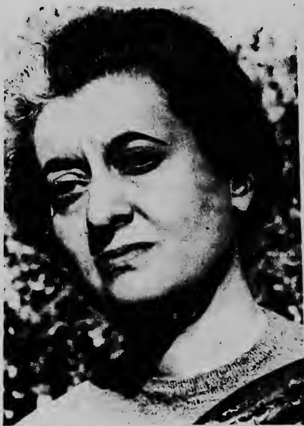
NUEVA DELHI--Aki riba nos por mira dos closeup di Señora Indira Gandhi (tumá dia 16) yiu muher di 48 aña di edad di ex-prime minister Nehru, posible prome ministra nobo di India. Actualmente señora Gandhi ta ministra india di informacion.

Por ultimo el a bisa: "A wor e dificultadnan ta bai cuminsa pa mi, mi mester studia portugues."